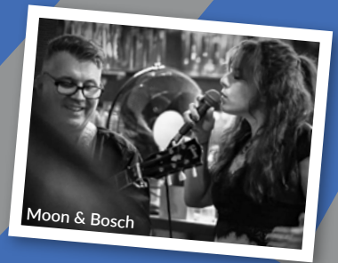
Moon & Bosch